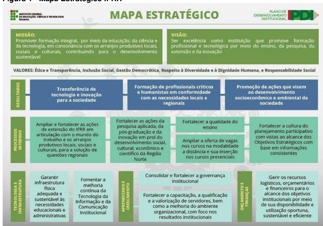
Figura 1 - Mapa Estratégico IFRR