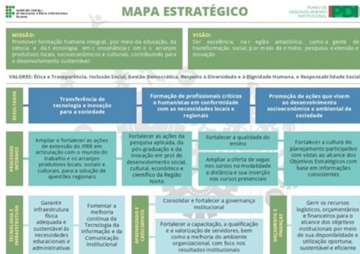
Figura 2 – Mapa Estratégico 2019-2023 do IFRR

Fonte: Plano de Desenvolvimento Institucional (PDI)